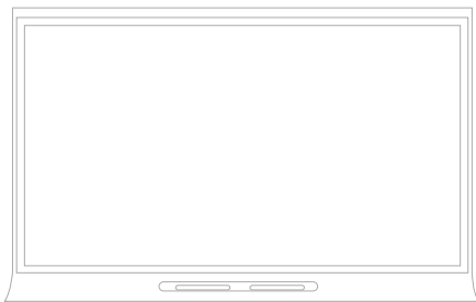
55" SMART Board 6055

Załączono oprogramowanie, z którym uczy się cały świat, zoptymalizowane dla stosowania interaktywnych ekranach SMART. Twórz konspekty lekcji w tym samym środowisku, w jakim będziesz je prowadzić. Najbardziej popularne oprogramowanie edukacyjne jest stworzone przez nauczycieli dla nauczycieli, aby w perfekcyjnej harmonii dostarczać uczniom inspiracji.